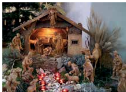
Unsere Weihnachtskrippe – von den Konfirmanden aufgebaut