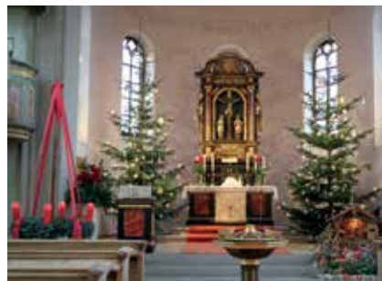
Altarraum in der Weihnachtszeit