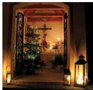
Waldweihnacht an der St. Michaelskapelle bei Bremenhof