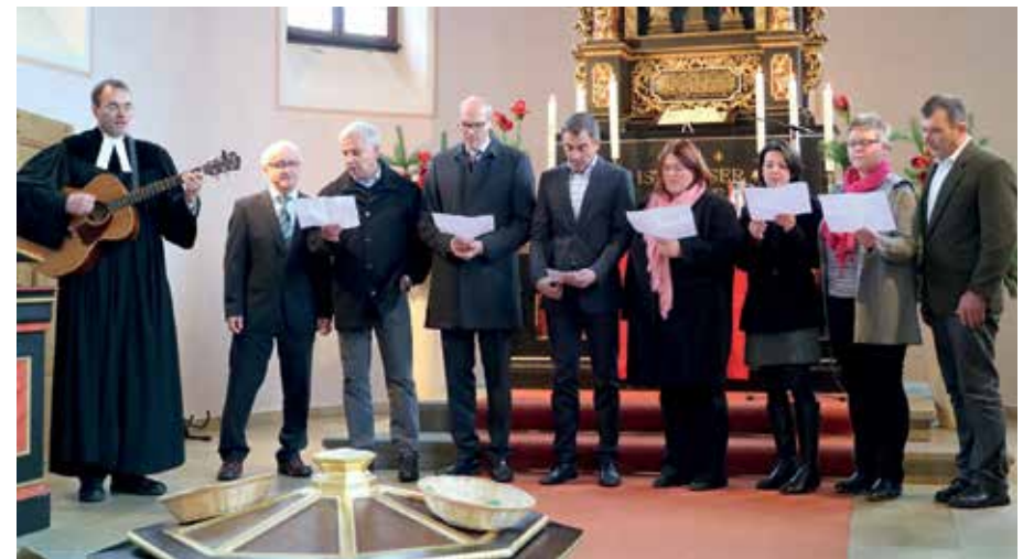
Neuer Kirchenvorstand