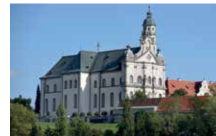
von St. Georg, Nördlingen, nach Kloster Neresheim