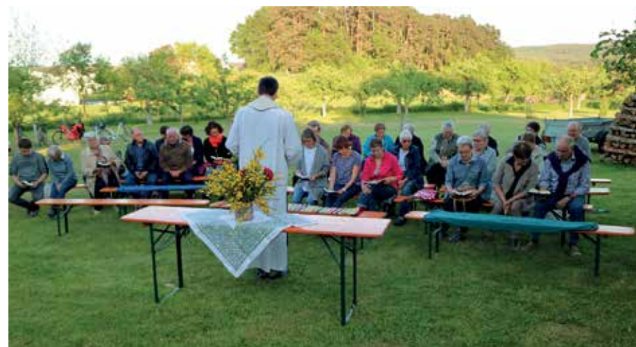
Erntebittgottesdienst im Reuth