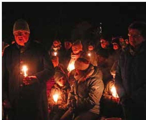
Waldweihnacht St. Michael