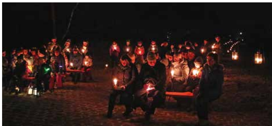
Waldweihnacht St. Michael