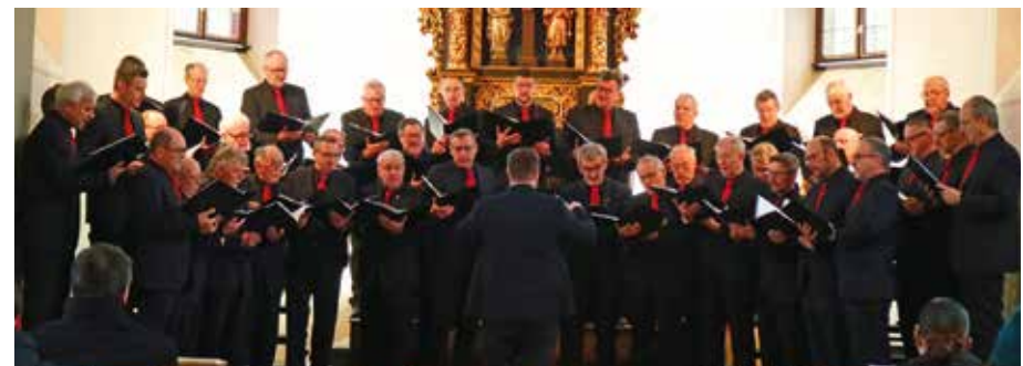
Adventskonzert MGV Frohsinn