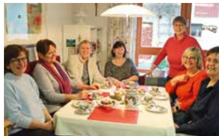
Walk and Talk - mal anders