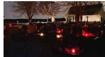
Friedhof Dürrenmungenau am Ewigkeitssonntag