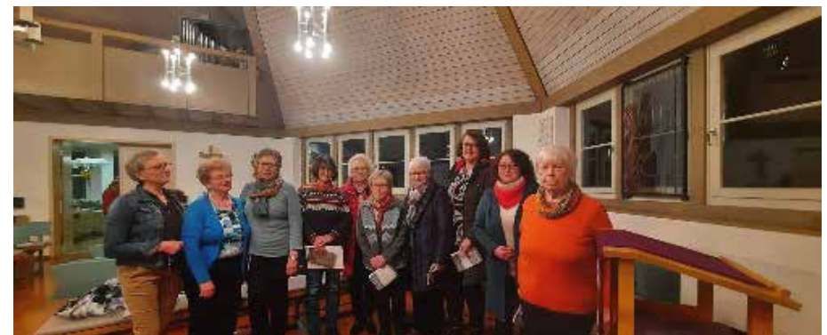
Unser aktiviertes Weltgebetstags-Team