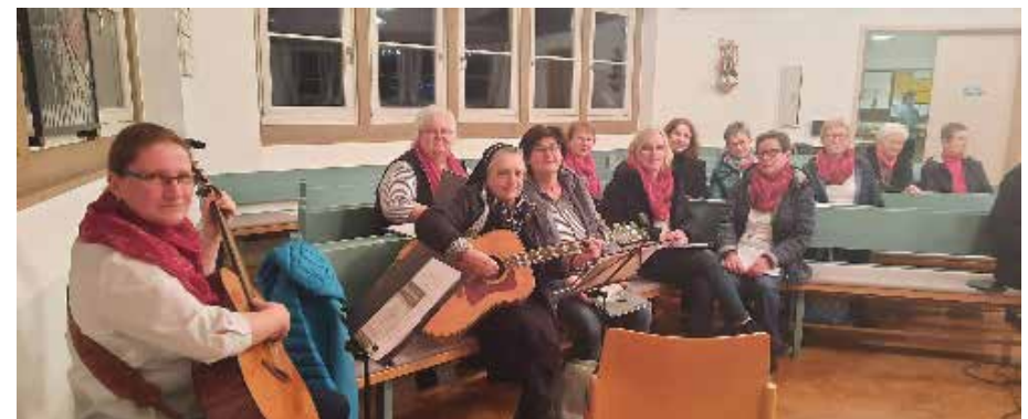
Der Chor „New Spirit“ begleitete uns