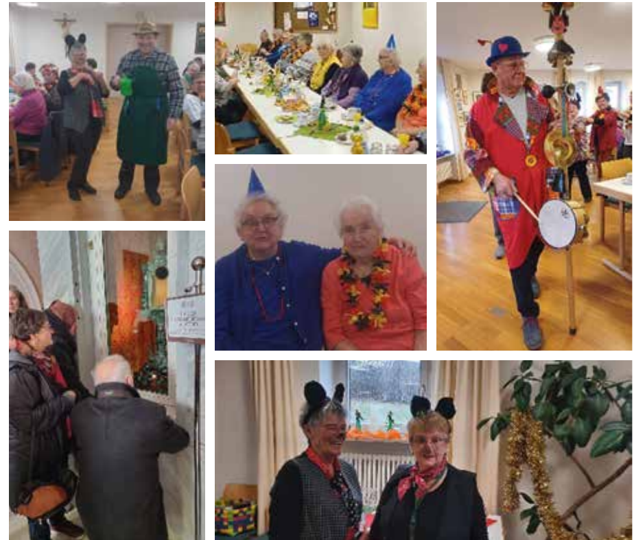
Bildrechte: Ökumenischer Gemeindenachmittag