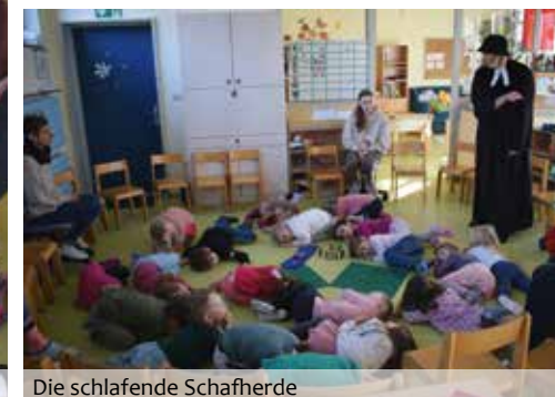
Die schlafende Schafherde