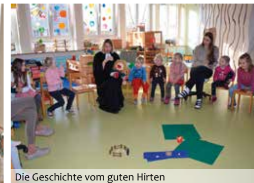
Die Geschichte vom guten Hirten