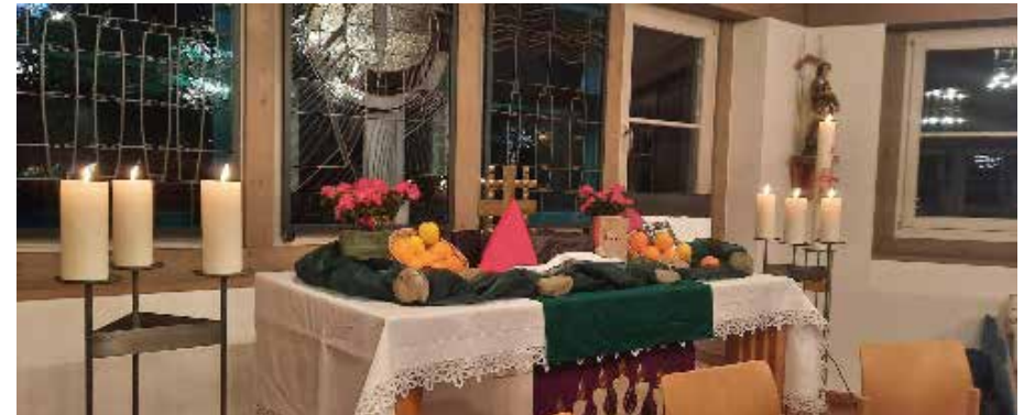
Dekorierter Altar in der Evangelischen St. Johanniskirche Abenberg